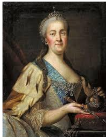
Catalina II de Rusia