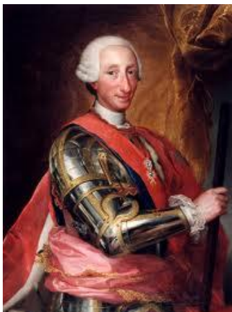
Carlos III de España