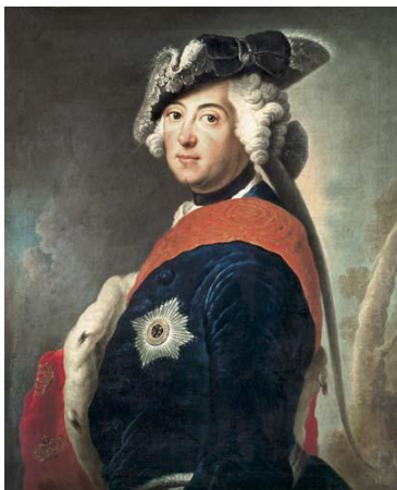
Federico II de Prusia